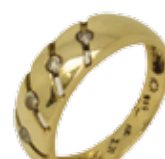
Primjer oznake čistoće na prstenu od zlata stupnja čistoće 585/1000: