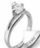
Primjer oznake čistoće na prstenu od platine stupnja čistoće 950/1000: