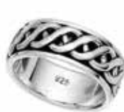
Primjer oznake čistoće na prstenu od srebra stupnja čistoće 925/1000:

Oznaka čistoće je troznamenakasta brojana vrijednost koja odgovara jednom od propisanih stupnjeva čistoće.